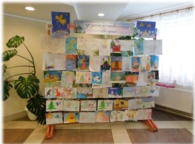
Конкурс детских рисунков «Под рождественской звездой»

Православная кафедра стала местом, где читатели знакомятся с духовной литературой, имеют возможность посещать интересные мероприятия.