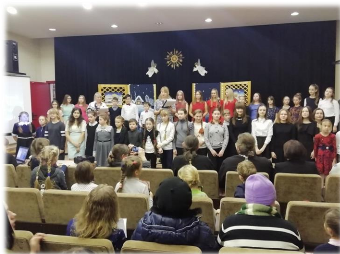
Утренник «Под звёздным небом Рождества»