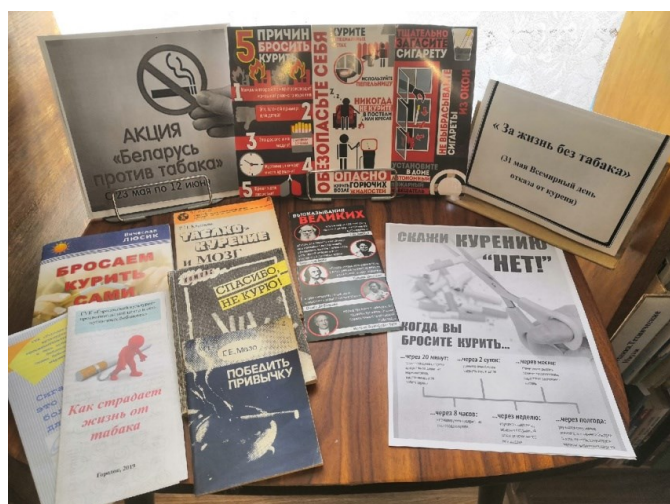
Інфармацыйная выстава “За жизнь без табака” Езьярышчанская гарпасялковая бібліятэка

31 мая ў Верамееўскай сельскай бібліятэцы прайшла гадзіна інфармацыі “Сigaretа коварный друг”, прымеркаваная да Сусветнага дня без тытуню і ў рамках рэспубліканскай інфармацыйна-адукацыйнай акцыі “Беларусь против табака”. Бібліятэкар расказала дзецям аб мэтах акцыі, аб важнасці інфармаваць навакольных аб згубных наступствах шкодных звычак і заклікаць кожнага весці здаровы лад жыцця.