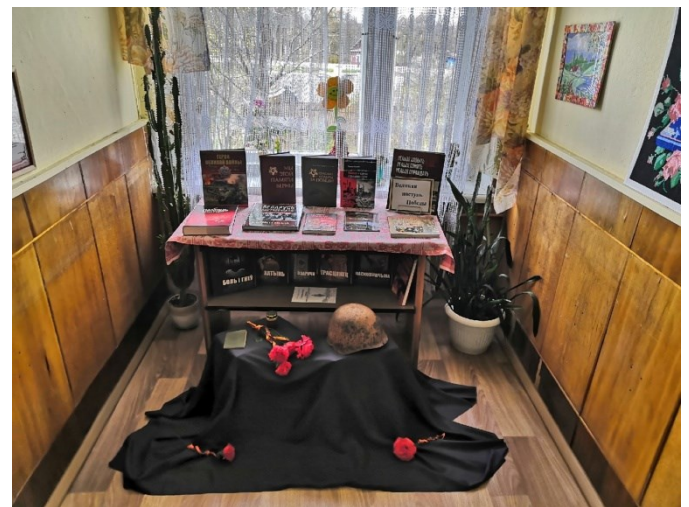
“Память о войне нам книга оживляет” Віраўлянская сельская бібліятэка