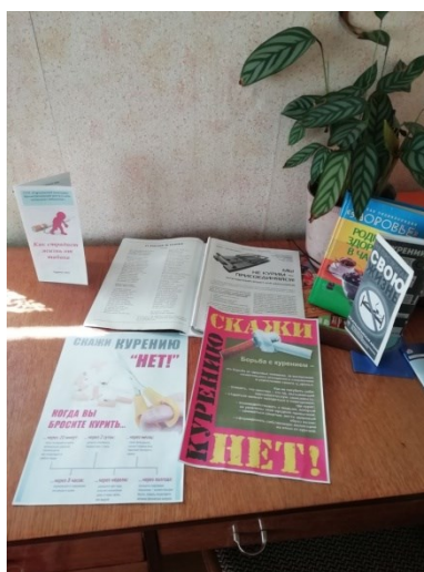
Выстава-заклік “Если хочешь долго жить – сигареты брось курить!” Гуркінская сельская бібліятэка