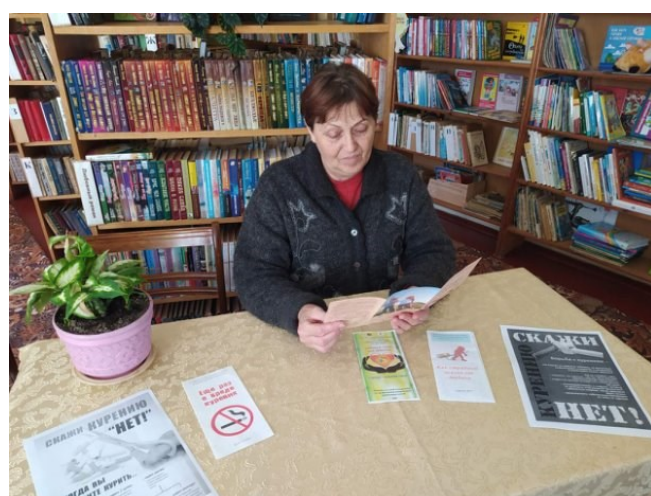
Тэматычная выстава “Скажи курению-нет!” Дубраўская сельская бібліятэка